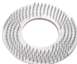
Dischi per raschiatura Scraping discs Disques racleurs